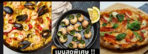
PAELLA ข้าวผัดสเปน / หอยเสกปลา / พิซซ่ามาการิตต้า