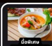
มือพิเศษ อาหารไทยในยุโรป